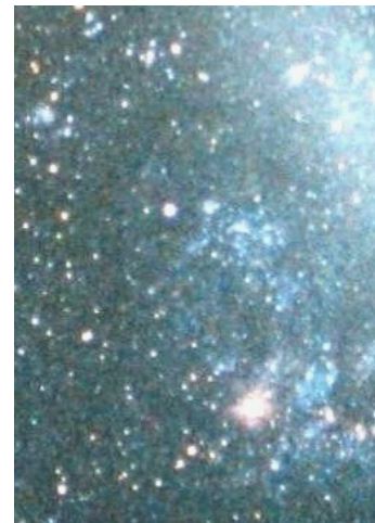
NMM - "Eco" cataclísmico (anillo oscuro) descubiert o por el autor

Podemos afirmarlo por cuanto la experiencia recogida nos ha permitido aportar con satisfacción, modestas pero diversas contribuciones a la labor del astrónomo aficionado, como el descubrimiento del eco de un cataclismo gigantesco en la Nube Mayor de Magallanes.