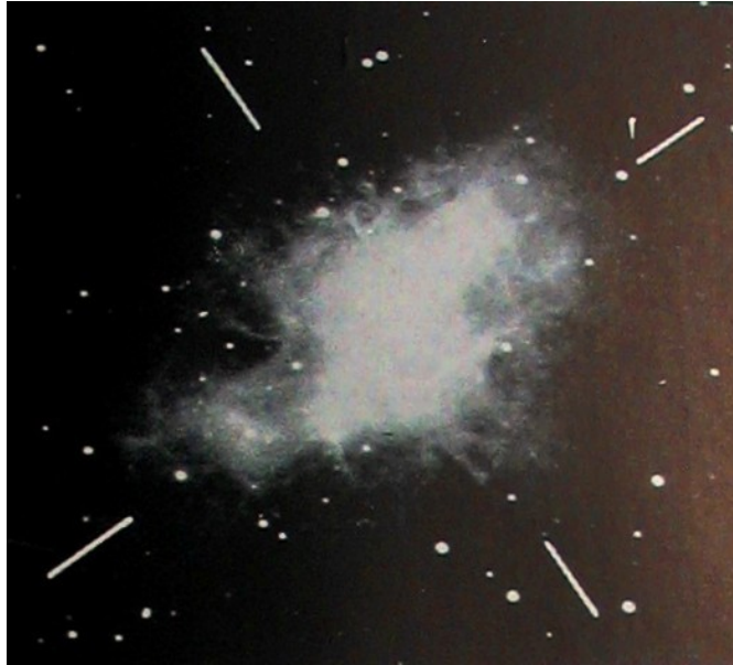
NGC 1952 – Nebulosa del Cangrejo – Ejes de los espectrogramas – PASP

perpendicular al primero, de los objetos muy distantes. El ignorado movimiento tangencial.