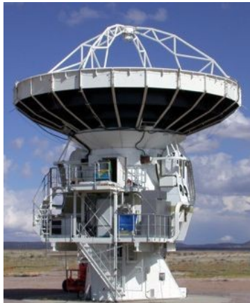
LLAMA - Antena prototipo propuesta – NRAO - IAR

("Large Latin American Millimeter Array")