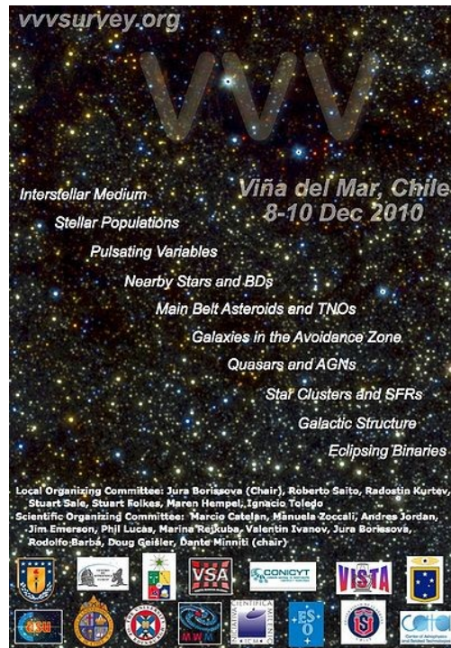
Afiche sobre la reunión VVV de Viña del Mar y sus tópicos diversos – OAC

La curiosidad humana prosigue más allá de ese umbral infrarrojo y con pie también en Latinoamérica – como en otros lugares del mundo - se desarrolla un ambicioso programa para la exploración del cosmos en las ondas de radio.