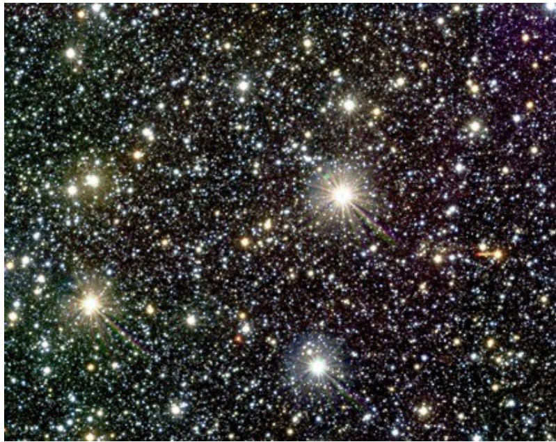
Un pequeño sector de una de las placas del VVV Survey

La encuesta internacional VVV que se lleva a cabo desde Chile mediante imágenes obtenidas con el telescopio VISTA (un telescopio de 4,1 metros, y su cámara de infrarrojo cercano VIRCAM), se centra en el bulbo galáctico y un sector escogido del plano galáctico en las bandas Z, Y, J, H y K del infrarrojo, cubriendo un área celeste de 520° cuadrados. En la misma participan activamente astrónomos de diversos centros prestigiosos de investigación del mundo, entre los que se encuentran muchos latinoamericanos (de Argentina, Chile y Brasil). VVV permite un acceso más profundo a la Vía Láctea en sus zonas de mayor densidad, facilitando establecer su estructura y evolución, entre otras muchas posibilidades insospechadas que van surgiendo a medida que los investigadores trabajan.