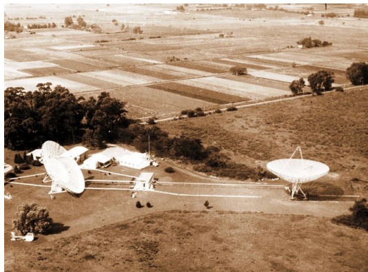
Vista aérea del Instituto Argentino de Radioastronomía

Obvio es destacar que el emprendimiento LLAMA, debe contar con todo el apoyo de la sociedad, no solo de los grupos científicos interesados. Constituye un pilar para el desarrollo, la integración socio económica y la educación superior en la región, colaborando en la superación de las endémicas limitaciones nuestras.