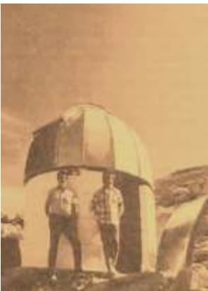
Observatorio de Misinta-Mucuchíes-Mérida – Universo