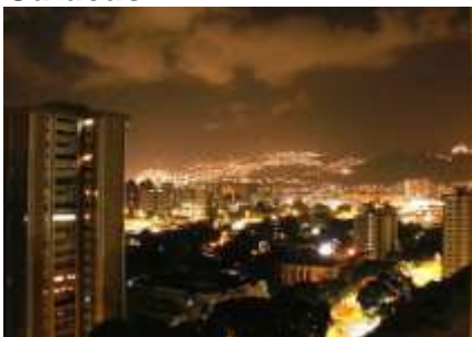
Contaminación lumínica de Caracas

http://www.mipunto.com/venezuelavirtual/000/002/007/001/009.jsp