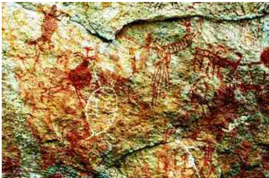
Petroglifos venezolanos – Web

Premio Herbert C. Pollock 2005 historiadelaastronomia.wordpress.com