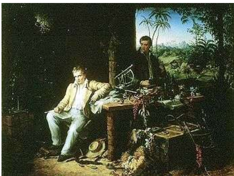
Humboldt y Bonpland en América con instrumental astronómico (Cuadrante) – Web

Pasa a constituir la primera manifestación de ejercicio de la astronomía en Venezuela que halló el autor, referencias a observaciones de meteoros efectuadas desde Cumaná, en el Caribe Venezolano durante 1799, que Alejandro de Humboldt efectuó y asocia con las posteriores lluvias meteóricas de 1833 y 1834, hoy conocidas como “Las Leónidas”; en las que llegaron a observarse diez mil meteoros por hora y por observador. Recordemos que este sabio, en compañía del francés Aimé Bonpland , recorrió diez mil kilómetros en tres etapas continentales. Las dos primeras en Sudamérica, partiendo de Cumaná y Caracas, y en el Alto Orinoco, visitando La Esmeralda y el río Casiquiare. La segunda de Bogotá a Quito por los Andes, y la tercera recorriendo la Nueva España, donde obtuvo las autorizaciones necesarias para recorrer el vasto territorio, con la condición de que no revelara esa información al gobierno de Estados Unidos.