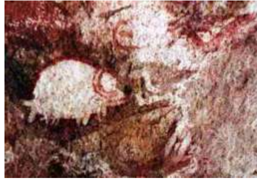
Pinturas rupestres – Web