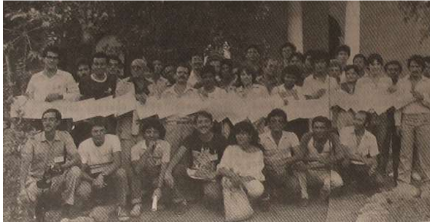
VII Encuentro Nacional de Aficionados a la Astronomía - Universo

El VII encuentro se concretó en la localidad de Coro entre el 12 y el 14 de Octubre de 1984, con gran asistencia de aficionados que expusieron respecto de diversos trabajos realizados. Se destacó la imagen del Sol tomada con un coronógrafo Goto en H\alpha , reproducida en esta nota .