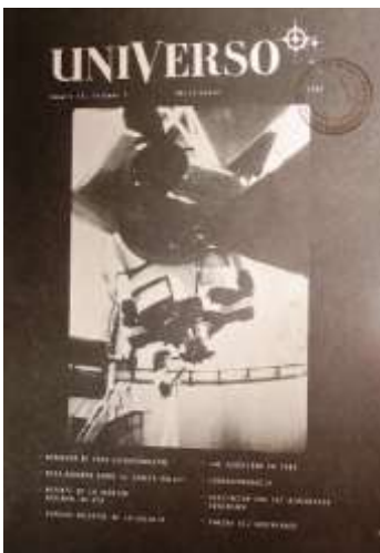
Portada de Universo – Abril-Junio – 1985.