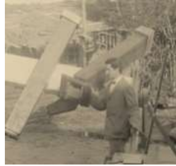
Chaudet en operaciones – OAC

Perrine describe a la corona – que se extendía algo más de un diámetro solar – como típica de un período entre máximo y mínimo de manchas y similar al eclipse de 1898. Chaudet destaca la presencia de numerosas protuberancias. Se verificaron además, los tiempos de contacto y la duración, que resultó de 2 minutos y 30 segundos contra los 2min 32s calculados. A pesar de esto, los resultados no fueron los esperados. La prensa internacional se hizo eco de esta expedición.