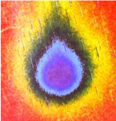
Núcleo del cometa Halley – Universo

Imagen tomada el 10-12-1985 por I. Ferrín, O. Naranjo, y R. Tellería (U. de los Andes) y F. Della Prugna (CIDA)