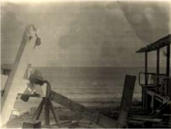
El Caribe venezolano desde la estación