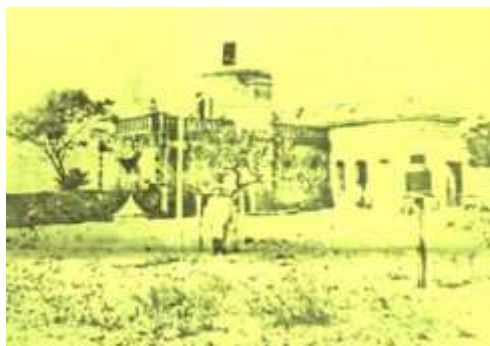
Observatorio Cajigal en 1891

El Observatorio Astronómico y Meteorológico de Caracas fue creado por decreto de Juan Pablo Rojas Paúl el 8 de septiembre de 1888. Este observatorio se instaló en la «Colina Quintana», adquiriéndola y cambiando su nombre a «Colina Cagigal» en honor al reconocido astrónomo y matemático Coronel de Ingenieros Juan Manuel Cagigal , quien es el fundador de los estudios matemáticos de Venezuela. A la colina también se le conoce como la Colina del Observatorio.