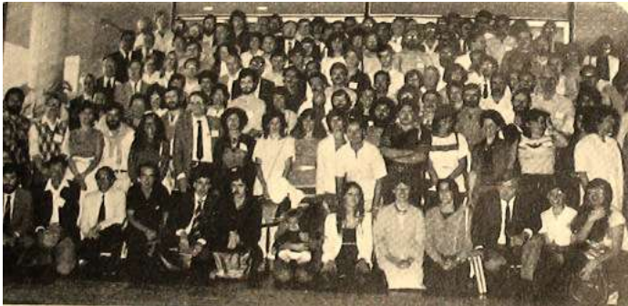
Asistentes a la Reunión – Universo