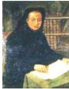
Louis Feuillée – Web

Si consideramos que Venezuela integraba la “Gran Colombia” en la etapa colonial, podemos remitirnos sobre ella a lo aseverado para el período en el trabajo sobre astronomía colombiana en este sitio, destacando las notables exploraciones realizadas por varias figuras en el período, como por ejemplo el sacerdote Louis Feuillée , perito hidrógrafo de origen francés, que en 1704 releva la bahía de Santa Marta y determina su latitud. Observa además, en compañía de Couplet , el eclipse lunar del 3 de Agosto de 1704; en 1705 levanta en planos el Castillo de San Felipe de Barajas de Cartagena de Indias y en 1711 explora las costas de Perú y Chile. Don Juan de Herrera y Sotomayor , español gobernador del castillo e ingeniero de fortificaciones del virreinato, observó seis eclipses de Luna y varias emersiones de los satélites galileanos entre 1719 y 1726; además determinó la latitud de Cartagena y de Panamá. En 1681 pasó a América, donde estuvo en Buenos Aires, Chile y Cartagena de Indias. En esta ciudad permaneció treinta años y en ella fundó la "Academia de Matemáticas".