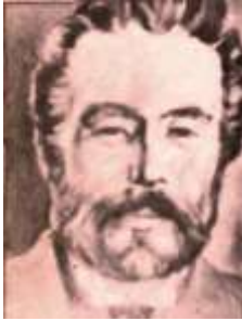
Maurizio Buscalioni

El primer director de Cagigal fue el astrónomo Maurizio Buscalioni , de nacionalidad italiana quien dedicó su labor a los aspectos meteorológicos y astrométricos dotándolo con instrumental moderno para su época, también de todo lo necesario para las primeras mediciones sistemáticas de presión atmosférica como temperatura, humedad y pluviosidad. También se llevaron a cabo observaciones astrométricas para la determinar la hora legal y la latitud geográfica del Observatorio. Buscalioni tenía como meta relacionarse con los mejores observatorios y astrónomos de América y Europa.