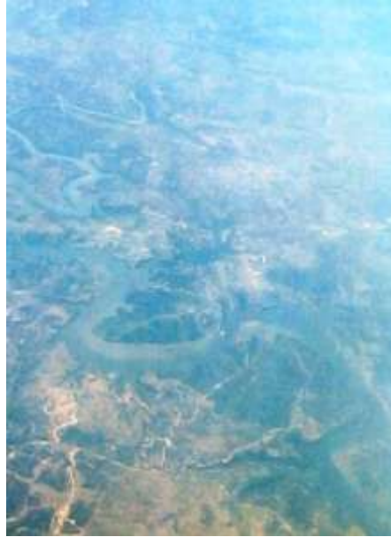
Imagen de la región – Sobrevuelo del autor

I - El origen probable de las etnias Caribe que habitan el territorio venezolano, no ha sido establecido aún con precisión por arqueólogos y antropólogos. Algunos sitúan el núcleo inicial en las selvas de las Guayanas (sean éstas de Venezuela, Guyana, Guayana Francesa y Surinam) o bien al sur o al norte, en la región central del río Amazonas en Brasil. Ocurre lo que con todas las áreas de dispersión. No resulta fácil fijar un origen. A nuestros efectos podemos obviar este aspecto sujeto a controversias, por razones de autoridad.