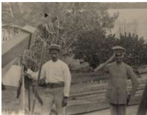
Ayudantes locales - OAC

Durante la mañana del jueves 3 de febrero llovió copiosamente, pero a la hora del eclipse el cielo se presentó cubierto por ligeras nubes.