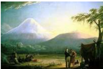
Humboldt al pie del Chimborazo - Web

Vale la pena reproducir el registro del evento en su obra “Cosmos”: “Noviembre – Del 12 al 14 – E fenómeno se produjo también, aunque muy rara vez, el 8 ó el 10. El recuerdo de la mayor lluvia de estrellas errantes que Bonpland y yo observamos en Cumaná, en la noche del 11 al 12 de Noviembre de 1799, hecho más vivo cuando la aparición análoga que tuvo lugar en 1833, en la noche del 12 al 13, fue una de las razones que facilitaran la admisión de la reproducción periódica de esos fenómenos en ciertos días determinados” . El sabio no solo utiliza sus propias observaciones en el análisis, sino los registros existentes sobre meteoros en distintos puntos del mundo, en particular los de la Astromische Nachrhisten.