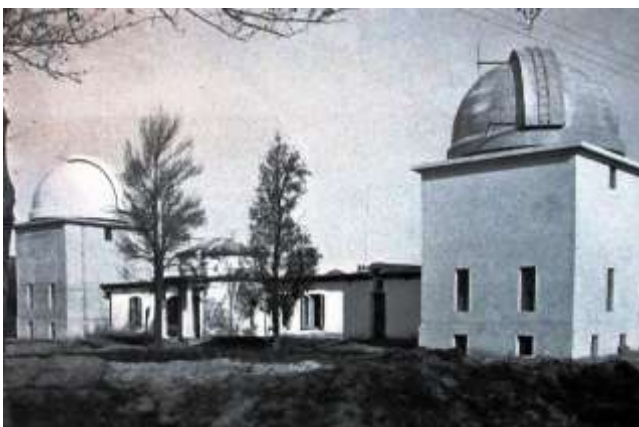
Nuevo y viejo Observatorio de Córdoba conviviendo todavía – Una etapa de transformación en la época - OAC

La tercera expedición realizada por el Observatorio de Córdoba, Argentina, para la observación de un eclipse total de Sol, que se convertiría en la última durante la gestión del Dr. Charles Dillon Perrine como director del mismo, se organizó para el eclipse del 3 de febrero de 1916, cuya faja de totalidad comenzaba en el océano Pacífico, cruzaba el norte de Sudamérica por Colombia y Venezuela, terminando en el Atlántico.