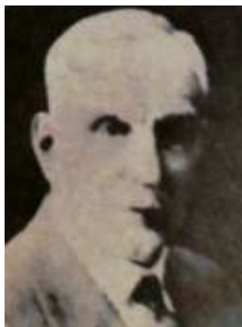
Henri Pittier - Web

respuestas eran negativas y no logró la dotación de instrumentos y la realización de observaciones astronómicas.