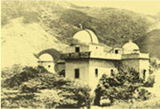
Observatorio Cagigal 1933 – 1955 – Web

Desde el año 1961 y hasta el presente, dirigen el Observatorio Cagigal los oficiales de la Armada de Venezuela.