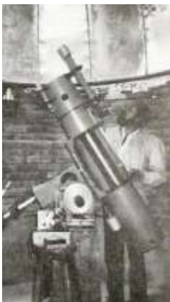
Telescopio en Misinta-Mucuchíes - Universo