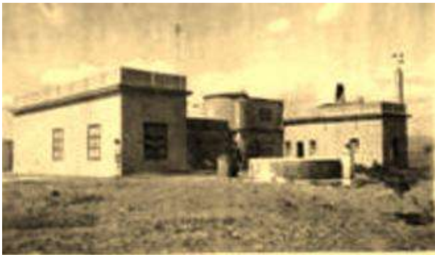
Observatorio Cagigal 1913 – 1932 – Web