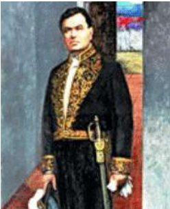
Juan de Herrera y Sotomayor - Web

Si consideramos que Venezuela integraba la “Gran Colombia” en la etapa colonial, podemos remitirnos sobre ella a lo aseverado para el período en el trabajo sobre astronomía colombiana en este sitio, destacando las notables exploraciones realizadas por varias figuras en el período, como por ejemplo el sacerdote Louis Feuillée , perito hidrógrafo de origen francés, que en 1704 releva la bahía de Santa Marta y determina su latitud. Observa además, en compañía de Couplet , el eclipse lunar del 3 de Agosto de 1704; en 1705 levanta en planos el Castillo de San Felipe de Barajas de Cartagena de Indias y en 1711 explora las costas de Perú y Chile. Don Juan de Herrera y Sotomayor , español gobernador del castillo e ingeniero de fortificaciones del virreinato, observó seis eclipses de Luna y varias emersiones de los satélites galileanos entre 1719 y 1726; además determinó la latitud de Cartagena y de Panamá. En 1681 pasó a América, donde estuvo en Buenos Aires, Chile y Cartagena de Indias. En esta ciudad permaneció treinta años y en ella fundó la "Academia de Matemáticas".