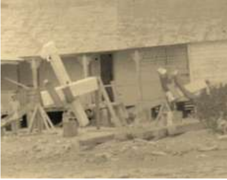
Instrumental en el patio de la residencia - OAC

El equipo llevado fue más modesto que el empleado en las expediciones realizadas con anterioridad a Brasil y Crimea, dadas las serias limitaciones económicas consecuencia de la crisis provocada por la guerra. Por similares razones, pocos observatorios enviaron sus comisiones para cubrir el fenómeno, tal el caso del Lick. Sí se encuentran presentes, los ingleses, quienes concurren con los mismos instrumentos que se emplearán tres años más tarde en Sobral, El principal instrumento ausente fue la gran cámara de 12 metros, así como los elementos para la observación de la corona solar con luz polarizada.