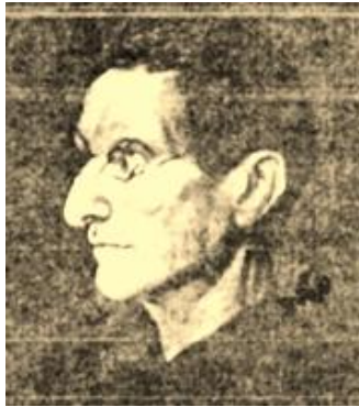
Benito Viñes Martorell SJ

La figura científica más destacada del Observatorio fue sin dudas el sacerdote Benito Viñes Martorell SJ , quien ocupa un sitio de honor en la ciencia cubana por haber redactado, el 11 de septiembre de 1875, el primer pronóstico de ciclón tropical documentado en la historia de la Meteorología. Un año después realizó extensos estudios de caso sobre tres huracanes que cruzaron sobre Cuba, exponiendo un detallado análisis teórico y un examen comparativo de las observaciones efectuadas en las regiones azotadas. Éste es el primer estudio científico sobre el impacto de desastres naturales de origen hidrometeorológico realizado en Cuba y, a la vez, el primero que se habría efectuado en la región del Caribe.