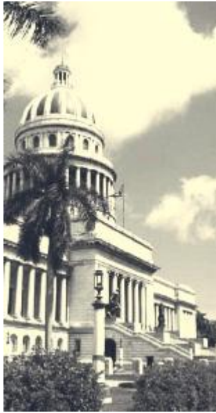
“Capitolio” - Academia de Ciencias de Cuba