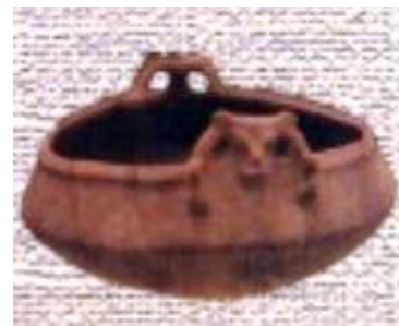
Cerámica indígena cubana

La astronomía liminal que necesariamente pudieron haber practicado esos pobladores primitivos, no pudo escapar a las cotas ya expuestas reiteradamente. Toda “astronomía” precolombina se limitaba a una la astronomía de posición aparente desde la Tierra, de los cuerpos celestes destacados al ojo humano desnudo, fenómenos estacionales y su periodicidad.