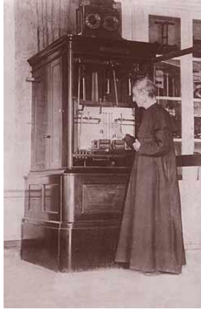
Benito Viñes Martorell SJ - Web

La figura científica más destacada del Observatorio fue sin dudas el sacerdote Benito Viñes Martorell SJ , quien ocupa un sitio de honor en la ciencia cubana por haber redactado, el 11 de septiembre de 1875, el primer pronóstico de ciclón tropical documentado en la historia de la Meteorología. Un año después realizó extensos estudios de caso sobre tres huracanes que cruzaron sobre Cuba, exponiendo un detallado análisis teórico y un examen comparativo de las observaciones efectuadas en las regiones azotadas. Éste es el primer estudio científico sobre el impacto de desastres naturales de origen hidrometeorológico realizado en Cuba y, a la vez, el primero que se habría efectuado en la región del Caribe.