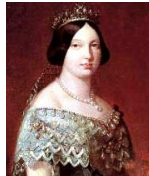
Isabel II de Borbón - Web

El Observatorio Astronómico y Meteorológico, creado en 1857 por un profesor jesuita, se convirtió en la principal fuente de información veraz y precisa sobre la temida y continua amenaza de los ciclones tropicales.