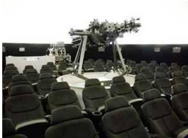
Proyector del Planetario