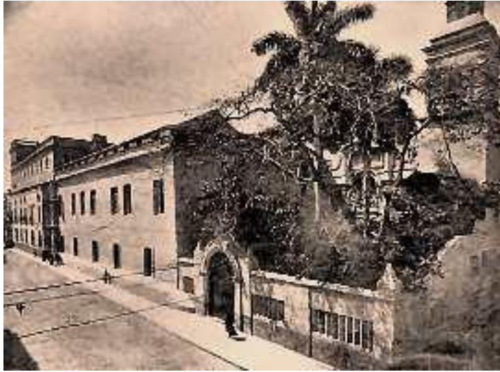
Antiguo convento Betlemita, asiento del colegio Belen hasta 1923

Varios centenares de jesuitas y miles de alumnos desfilarían por aquel local, entre los que no se pueden olvidar a: