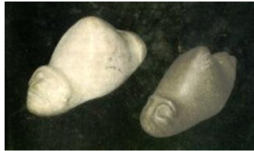
Figurillas arqueológicas cubanas

En el Sumidero de Jibacoa, en las Alturas de Guamuhaaya, zona de actual desarrollo cafetalero, en pleno corazón del Escambray villaclareño, se han encontrado 50 sitios arqueológicos con objetos y restos humanos con una antigüedad de más de 2 000 años.