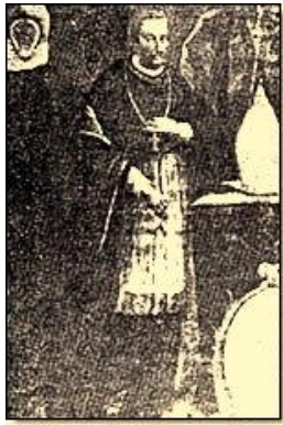
Obispo de Compostela – Web

Como en el local completo, que se extendía desde la calle Compostela hasta la calle Picota, y entre las de Luz y Acosta, había sido una casa de convalecencia creada por los Betlehemitas en 1720, su iglesia estaba dedicada a la Señora de Belén, el colegio, bautizado como Real Colegio de La Habana desde su creación por Real Cédula de Isabel II de Borbón el 26 de noviembre de 1852, acabó llamándose Real Colegio de Belén.