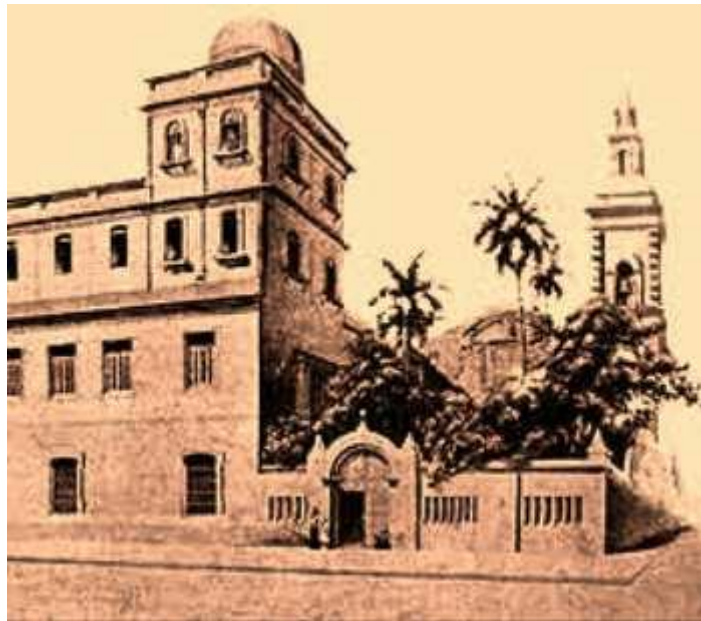
Primer Observatorio Cubano – Colegio Belen – Habana – Web

Premio Herbert C. Pollock 2005 historiadelastronomia.wordpress.com