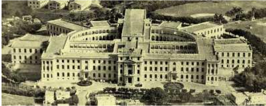
Vista aérea del nuevo edificio