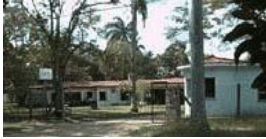
Instituto de Geofísica y Astronomía – IGA - Web

La actividad astronómica destacada en la isla, se lleva a cabo por intermedio de Instituto de Geofísica y Astronomía – IGA – de Cuba.