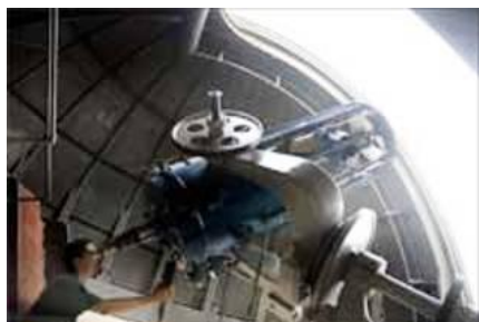
Observatorio del Dr. Miguel Mery - Web

III — La actividad astronómica no profesional en la isla es diversa. El único vínculo con nuestro medio y la mayor parte de Latinoamérica, se realiza a través de la LIADA. Respecto de ella brindamos estas notas orientadoras que si bien no la cubren totalmente, constituyen un índice panorámico de la misma.