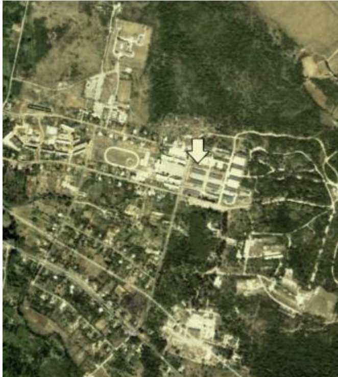
Instalaciones del CITMA - Web