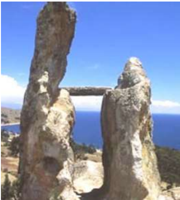
Pachataka - Medidor del tiempo – Web

La mal llamada “Horca del Inca”, es un observatorio astronómico solar que en los últimos años fue denominado por los arqueólogos bolivianos como Pachataka, medidor del tiempo.