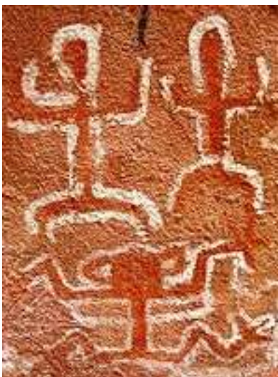
Incamachay – Pintura rupestre - (2.000 años de antigüedad) - Chuquisaca. – Web

Bolivia comparte una historia antigua común con el Perú. En el territorio boliviano se desarrollaron civilizaciones antiguas como Tiahuanaco y la Cultura Hidráulica de las Lomas. Hacia el siglo XV, la región andina fue anexionada por el Imperio incaico. Debemos aquí remitirnos a lo expresado en nuestra nota sobre astronomía peruana, para evitar repeticiones.