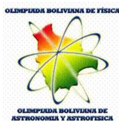
Logo de la 14 a OBF y 4 a OBAA - Web