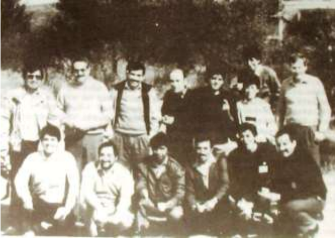
III Encuentro de Aficionados – Universo