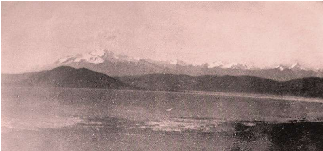
Lago Titicaca con el Nevado de Illampu al fondo – 1896