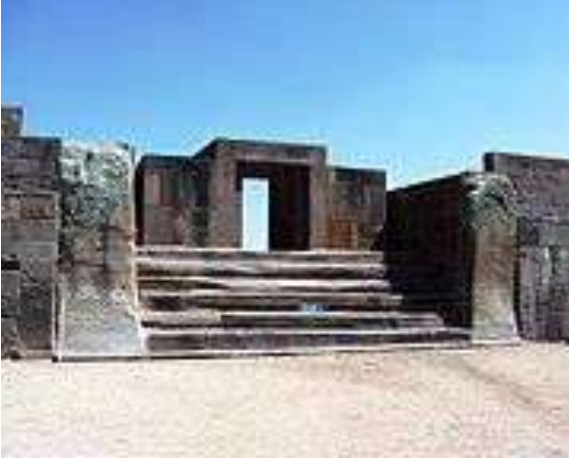
Templo de Kalasasaya - Zona Arqueológica de la Cultura Tiwanaku