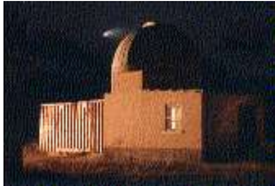
Observatorio Astronómico de Patacamaya - Web

En el altiplano boliviano, se encuentra la localidad de Patacamaya a 100 km sur de la ciudad de La Paz. Allí está ubicado el Observatorio Astronómico de Patacamaya, dependiente de la carrera de Física de la Universidad Mayor de San Andrés "UMSA".