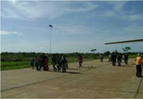
Delegaciones en aeropuerto de Cobija – Web

En ambas olimpiadas se evaluaron las categorías de 6o , 7o, 8o de Primaria, 1o, 2o y 3o de Secundaria. La categoría de 4o de Secundaria no participo en Yacuiba, ellos participaron en las 2 etapas previas de clasificación para la 14 va OBF - 4 ta OBAA y los ganadores de esta categoría tienen como principal premio el ingreso libre y directo a las universidades comprometidas con el proyecto.