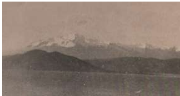
Nevado de Illampu – 1896 – Pop. Astr.